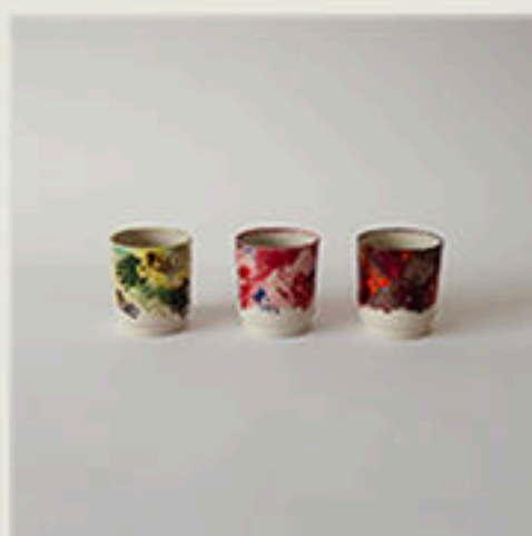
© Bougies pour Edmond de Rothschild Héritage - 2021