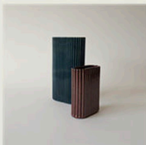
© Vases Godron pour Cartier - 2018