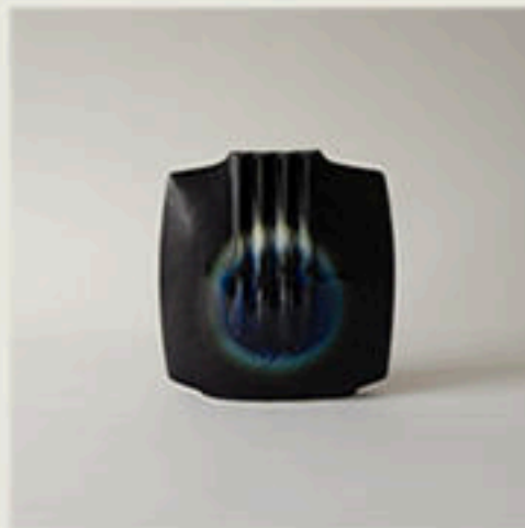
© Xavier Faut pour Virebent - 1975