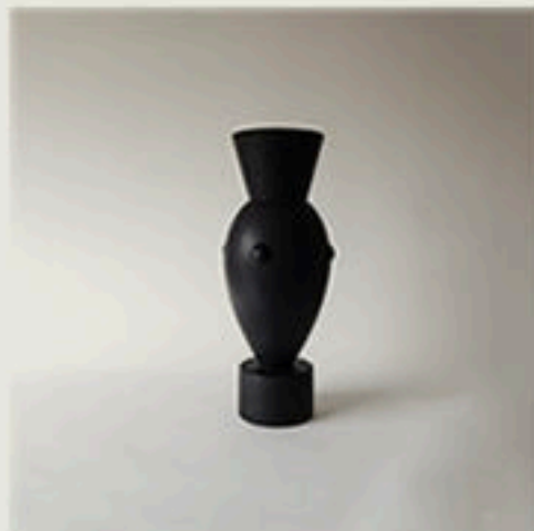
© Champs de mars - Olivier Gagnère - 1995