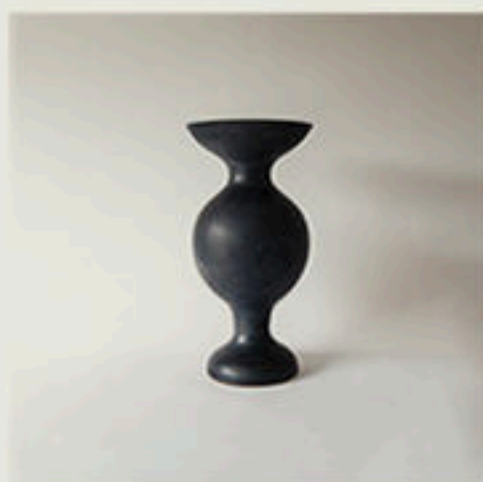
© Vase Belem - Vincent Collin - 2008