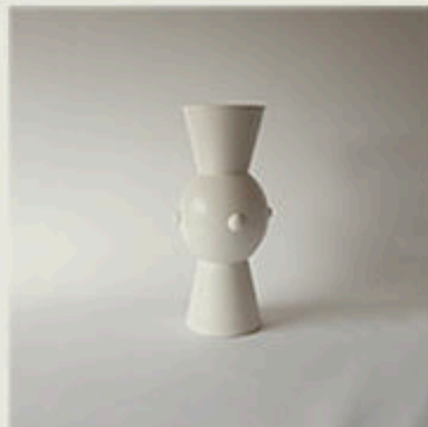
© Vase Marly - Olivier Gagnère - 1995