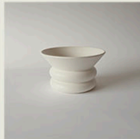
© Coupe Lolus - Vincent Collin - 1995