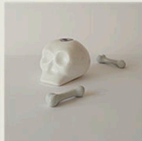
© Bougeoir Hamlet - Vincent Collin - 2005