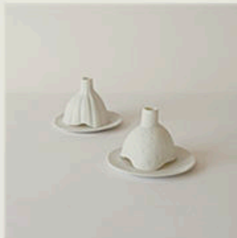
© Phosphores Teé Teé - Virebent - 1999