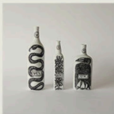
© Bouteilles curieuses - Vincent Collin - 2008