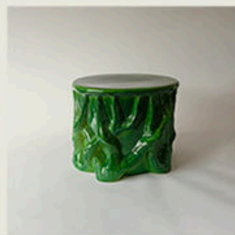
© Tahound Roots - Vincent Collin - 2018