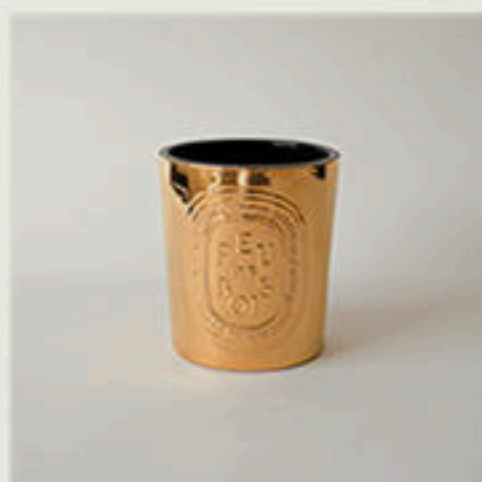
© Feu de bois or 24 carats pour Diptyque - 2018